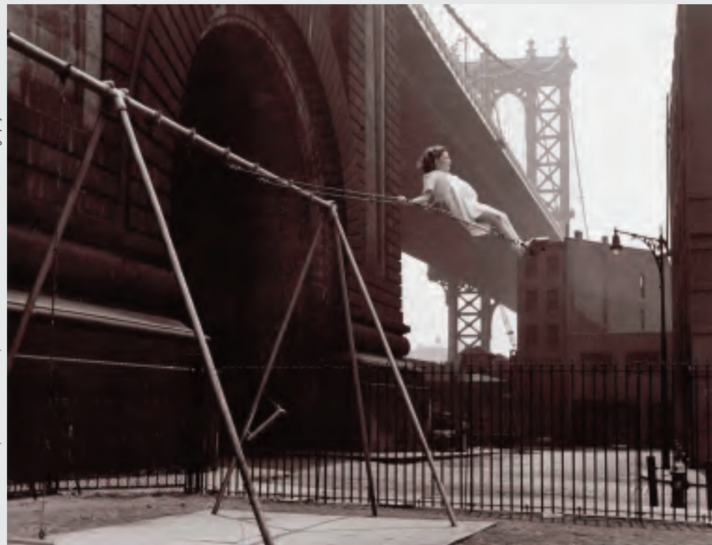
Walter Rosenblum, Bambina sull'altalena, dalla serie i Pitt Street, 1938. ©Rosenblum Photography Archive

eseguite da una sessantina di fotografi accompagnano le interviste ai membri dell'associazione e i filmati che rievocano anche coloro scomparsi da tempo. Nina Rosenblum e Daniel Allentuck hanno realizzato un progetto durato dodici anni, nello stile anticonformista e rigoroso delle loro celebri indagini indipendenti, riportando alla luce una storia esemplare da uno dei momenti più bui della democrazia americana.