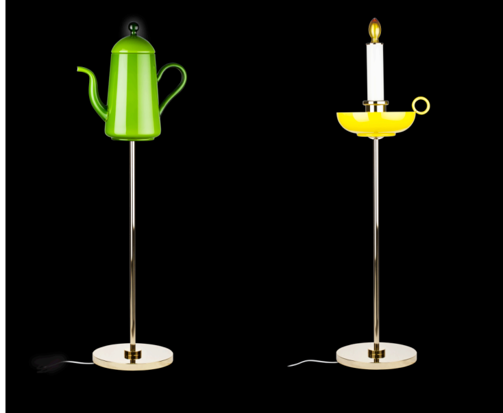
Chocolate Pot Lamp