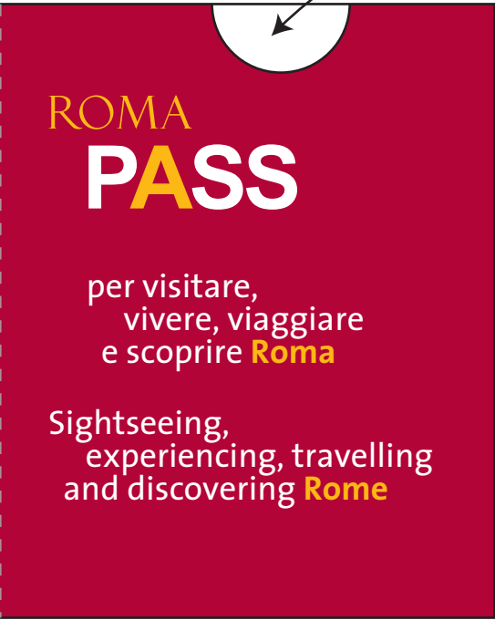
interno/ 2° e 3° di copertina

mappa chiusa e incollata sulla seconda di copertina