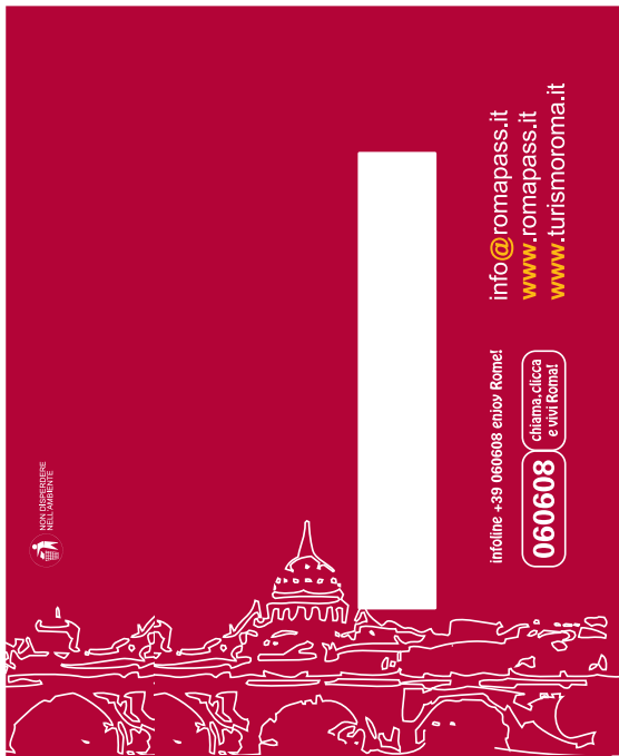
retro/4° di copertina