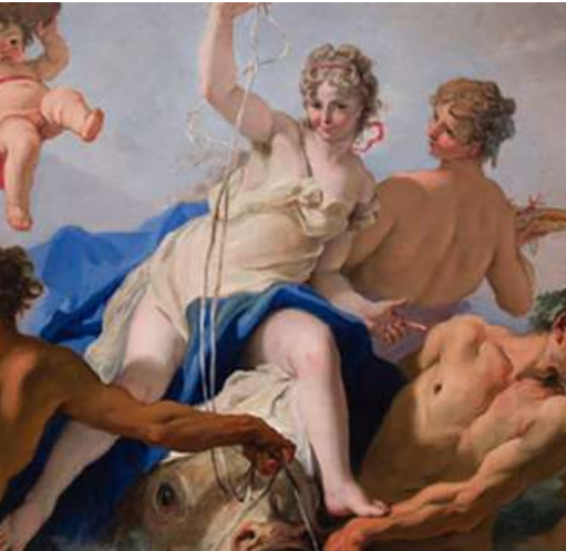
L'INCANTO DELLA BELLEZZA