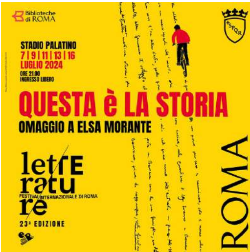
LETTERATURE FESTIVAL INTERNAZIONALE DI ROMA