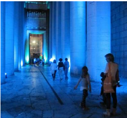
SPETTACOLI SERALI DEL PLANETARIO