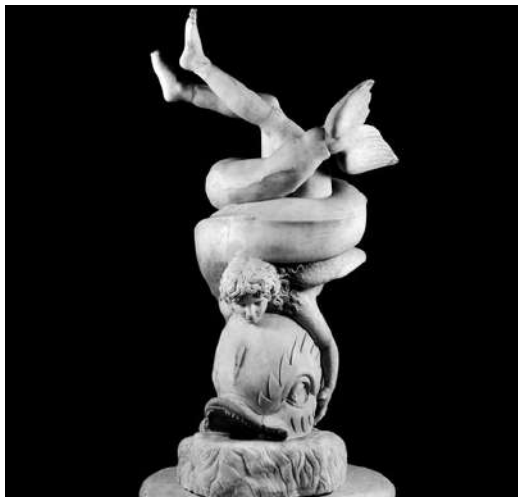
I FARNESE NELLA ROMA DEL CINQUECENTO