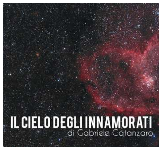
NUOVO SPETTACOLO DEL PLANETARIO